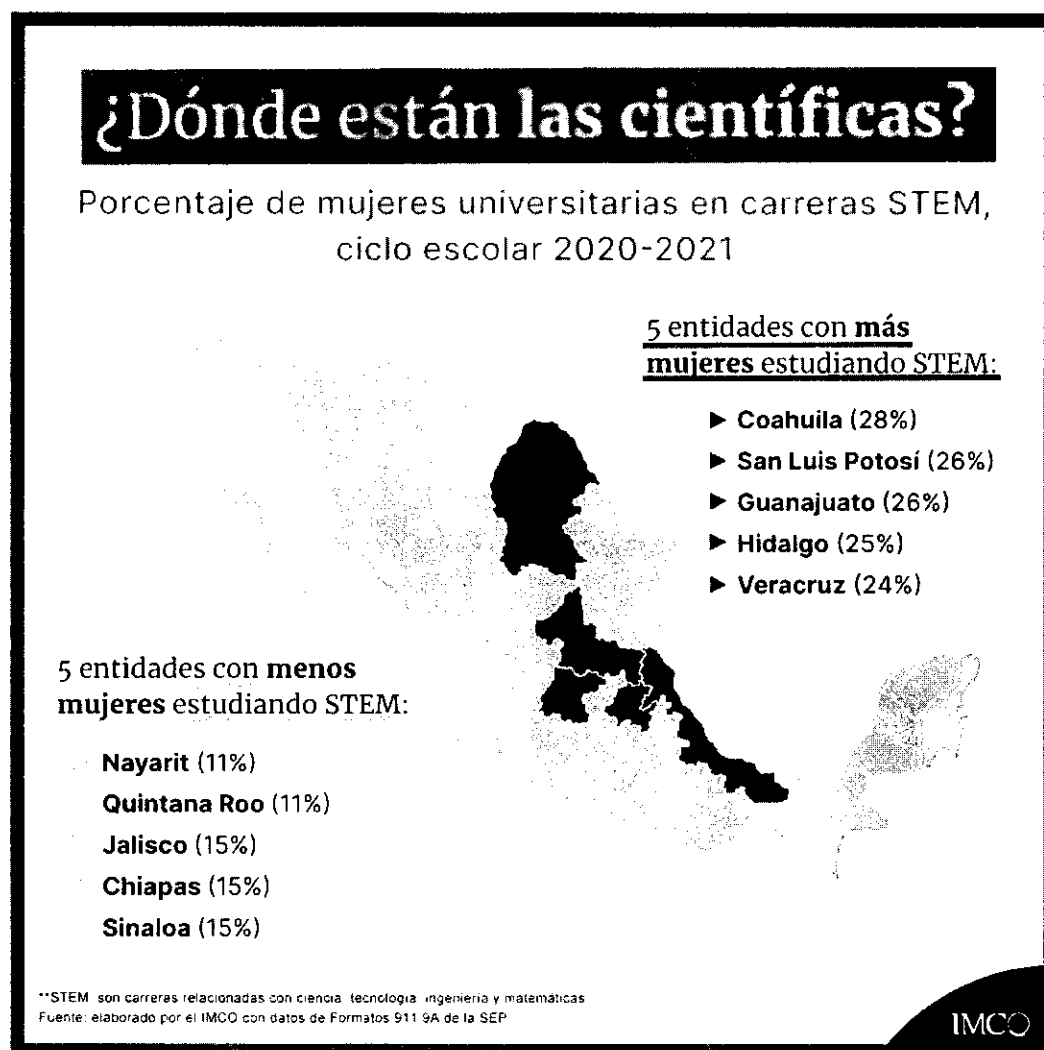
Imagen elaborada por el IMCO, retomada del artículo de investigación "¿Dónde están las Científicas?", 2022.

federativas, puesto que, en 16 de las 32 entidades del país, el porcentaje de mujeres que estudian carreras STEM, se encuentra entre el 17 y 24%, mientras que la entidad con mayor participación femenina es Coahuila con 28%, seguida por San Luis Potosí y Guanajuato, ambas con 26%. (Se anexa imagen)